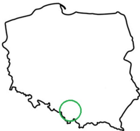
Rys. 1: Orientacyjny obszar prowadzenia monitoringu

Próbki osadu pobrane w miejscu zrzutu będą przekazywane do badania zawartości izotopów radu ( ^{226}\text{Ra} oraz ^{228}\text{Ra} ), toru ( ^{228}\text{Th} ), ołowiu ( ^{210}\text{Pb} ), potasu ( ^{40}\text{K} ), a także innych sztucznych nuklidów promieniotwórczych, np. cezu ( ^{137}\text{Cs} ), metodą spektrometrii promieniowania gamma, zgodnie z wewnętrzną akredytowaną procedurą badawczą SCR/ZLGIG/2-004 wyd. 8 z 25.08.2023.