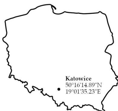
Rys. 1: Położenie punktu pomiarowego na mapie Polski.

W okresie 01.04.2024 - 30.06.2024 wykonano serię pomiarów przestrzennego równoważnika mocy dawki H^*(10) , na terenie Śląskiego Centrum Radiometrii Środowiskowej, Głównego Instytutu Górnictwa – Państwowego Instytutu Badawczego pod adresem Plac Gwarków 1, 40-179 Katowice, Rys. 1. Współrzędne punktu pomiarowego: 50^{\circ}16'14,89''N , 19^{\circ}01'35,23''E .