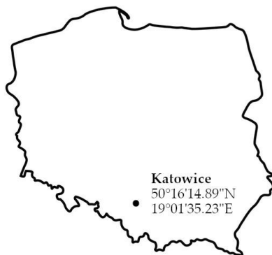
Rys. 1: Położenie punktu pomiarowego na mapie Polski.

W okresie 01.01.2024 - 31.12.2024 wykonano serię pomiarów przestrzennego równoważnika mocy dawki H^*(10) , na terenie Śląskiego Centrum Radiometrii Środowiskowej, Głównego Instytutu Górnictwa – Państwowego Instytutu Badawczego pod adresem Plac Gwarków 1, 40-179 Katowice, Rys. 1. Współrzędne punktu pomiarowego: 50^{\circ}16'14,89''N , 19^{\circ}01'35,23''E .