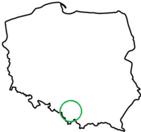
Rys. 1. Orientacyjny obszar prowadzenia monitoringu

Stężenia aktywności izotopów 226 Ra i 228 Ra określono przy użyciu następujących linii energetycznych: 226 Ra (186, 351, 609 keV) i 228 Ra (911 keV).