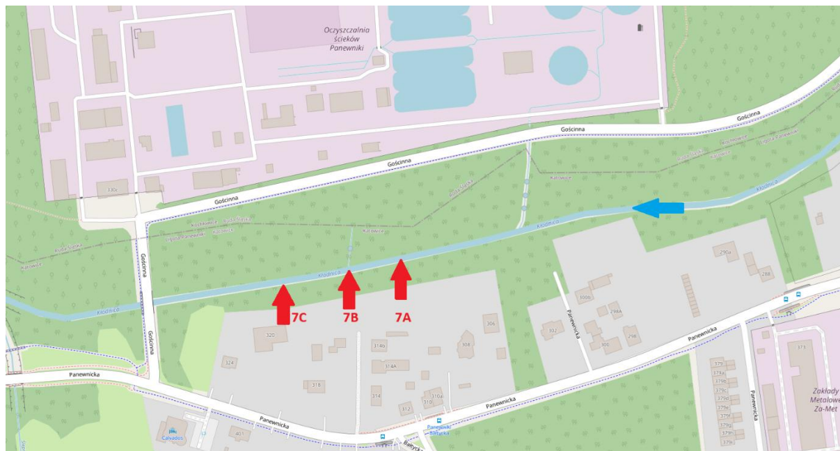
Rys. 3 Schemat kodowania próbek w punkcie zrzutu oznaczonym jako 7.

Na poniższym rysunku przedstawiono schematycznie miejsca oraz sposób kodowania próbek na przykładzie punktu nr 7 (Kłodnica).