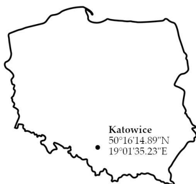
Rys. 4: Położenie punktu pomiarowego na mapie Polski.

Zgodnie z definicją przestrzenny równoważnik dawki - H^*(10) to równoważnik dawki w punkcie pola promieniowania, jaki byłby wytworzony przez odpowiednie rozciągnięte i zorientowane pole w kuli ICRU (International Commission on Radiological Protection - Międzynarodowa Komisja Jednostek Radiologicznych) na głębokości 10 mm, na promieniu przeciwnym do kierunku pola zorientowanego.